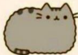
zadowolenie (ale pospalem)