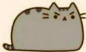
złość (ktoś mnie obudził)