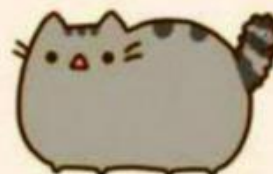
strach (wstać o 6:00?)