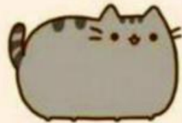
szczęście (właśnie idę spać)