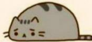
smutek (musiałem wstać)