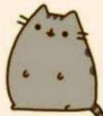
ciekawość (gdzie jest łóżko?)