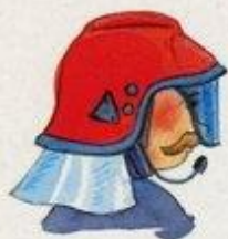
ochronny hełm strażacki

Praca strażaków jest trudna i bardzo niebezpieczna. Strażacy nie mogliby jej wykonywać bez odpowiedniego sprzętu ratowniczego.