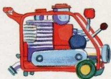
Pompa pracuje i wypycha wodę z węża.

Wodę do gaszenia pobiera się przez hydrant.